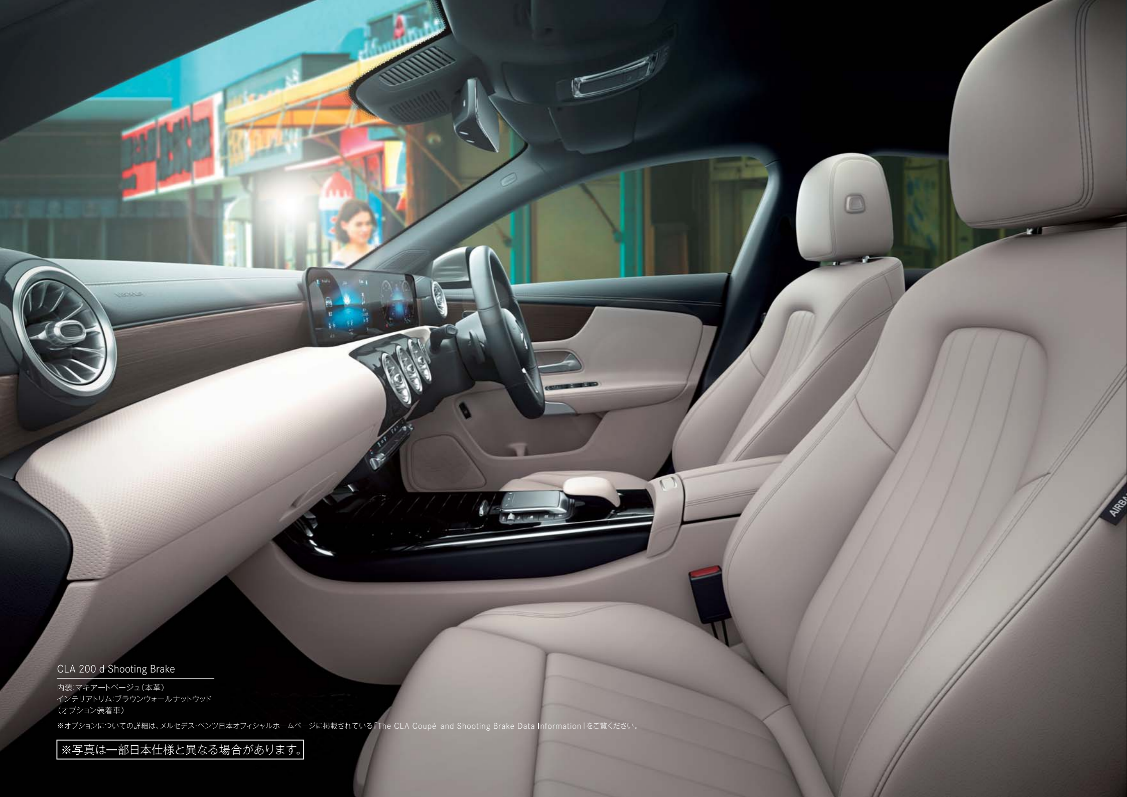
CLA 200 d Shooting Brake

内装:マキアートベージュ(本革) インテリアトリム:ブラウンウォールナットウッド (オプション装着車)