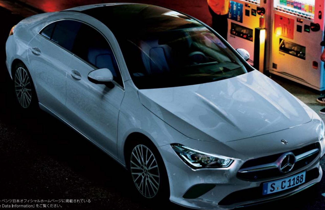
CLA 200 d