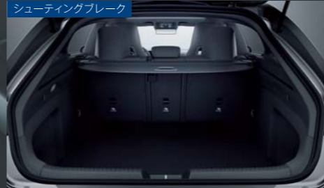
シューティングブレーク

※オプションについての詳細は、メルセデス・ベンツ日本オフィシャルホームページに掲載されている「The CLA Coupé and Shooting Brake Data Information」をご覧ください。