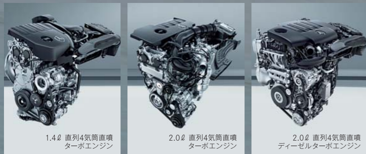
1.4ℓ 直列4気筒直噴ターボエンジン

最適形状のドアミラー、エンジンコンパートメントからリアアクスルまでの大部分を覆うアンダーパネル、ホイールスポイラーなどの採用によって、クラス最高レベルのCd値、クーペ:0.23、シューティングブレーク:0.26を実現。優れた空力性能が燃費向上、高い高速安定性・静粛性に貢献します。※数値は欧州参考値。