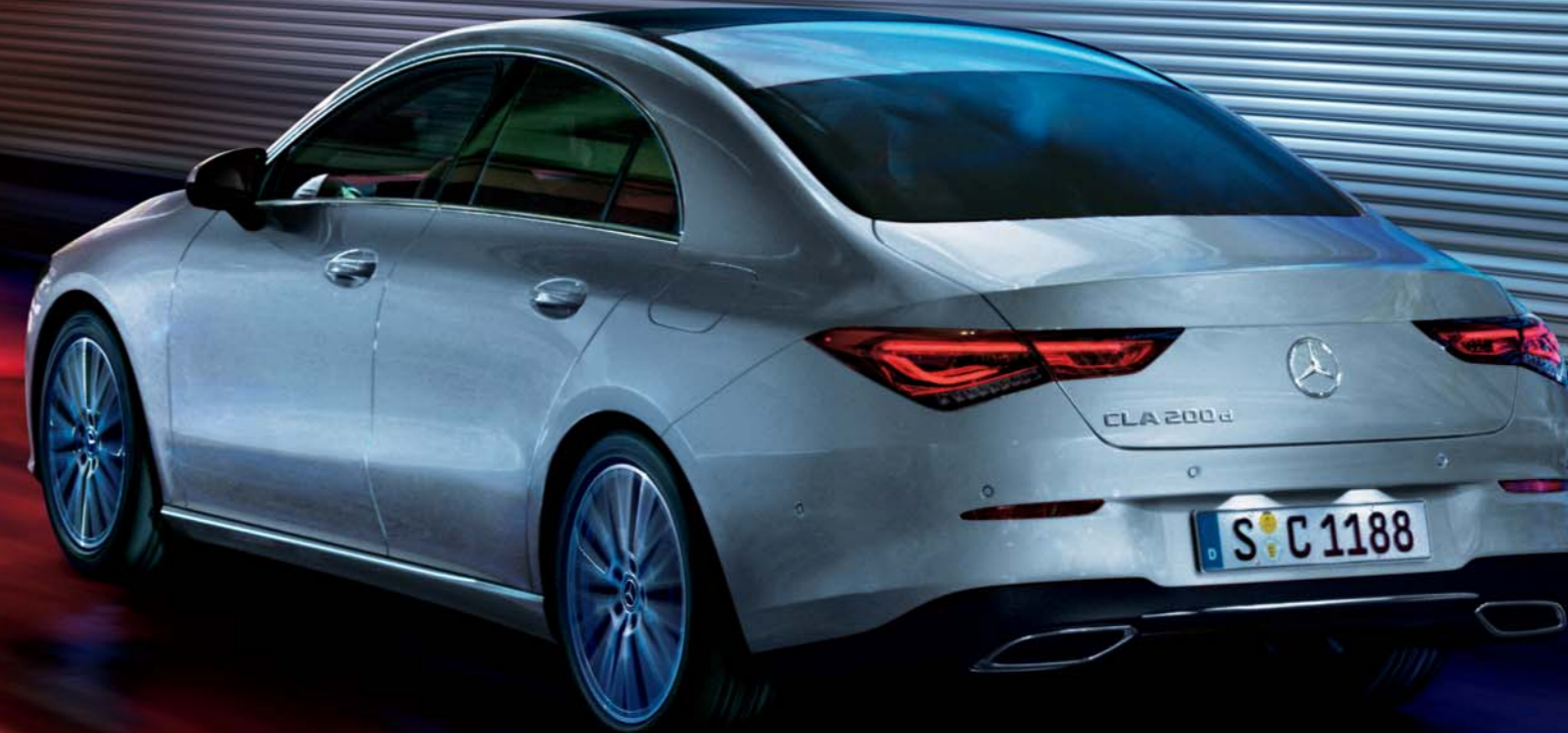
CLA 200 d