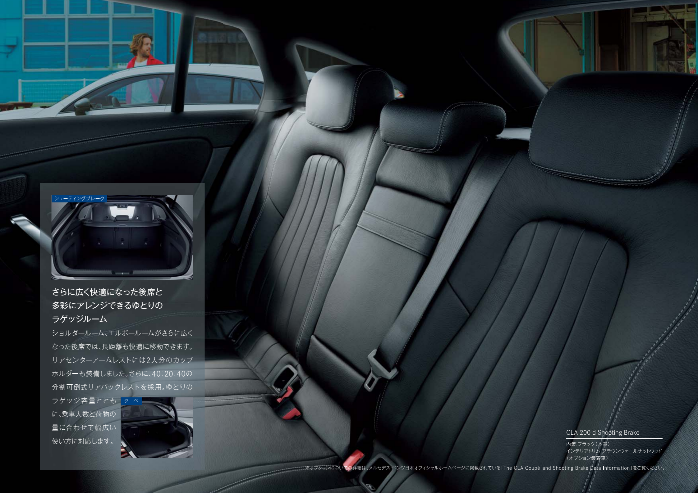
CLA 200 d Shooting Brake

内装:ブラック(本革) インテリアトリム:ブラウンウォールナットウッド (オプション装着車)