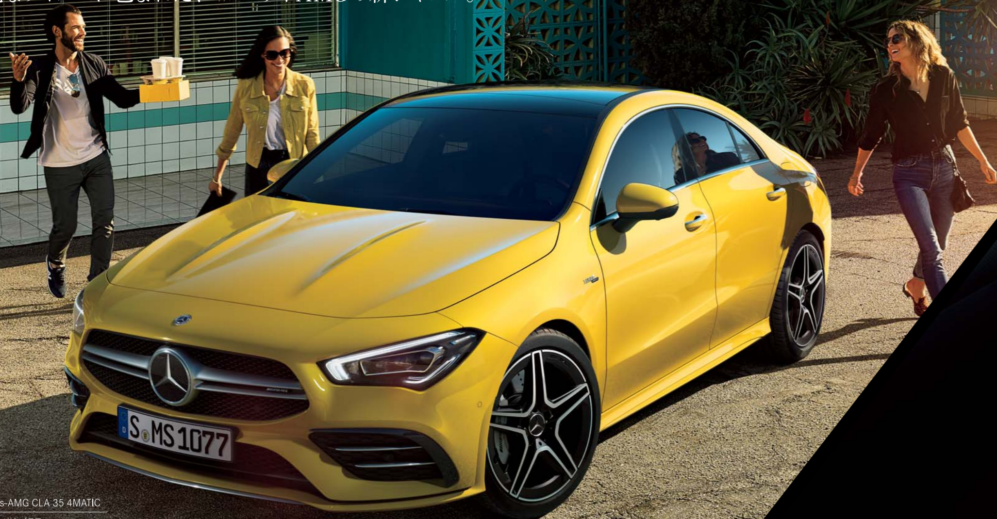
Mercedes-AMG CLA 35 4MATIC