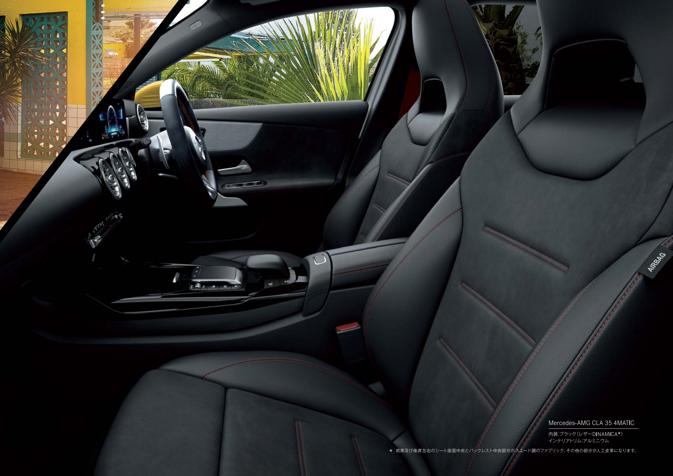
Mercedes-AMG CLA 35 4MATIC