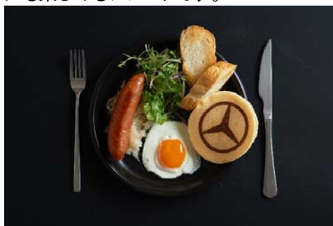
スタープレート 1,400 円

「Mercedes me Tokyo HANEDA」限定、「Mercedes me」コラボレーションプレート「スタープレート」。イートイン限定のここだけでしか食べられないスペシャルプレート、eggcellentの魂のオーガニック卵やソーセージや産直野菜のサラダ、そこにスイーツのスターパンケーキものった朝食でもランチでもディナーでもヘルシーにお腹も満足、目にも楽しめるプレートです。