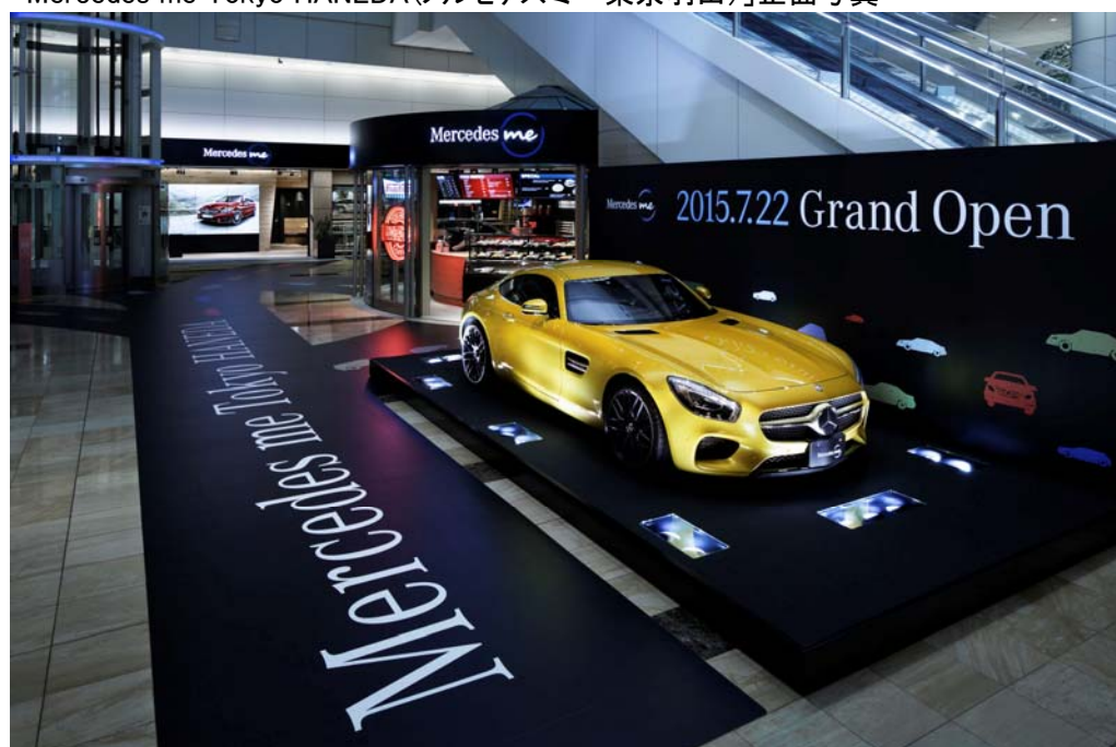
「Mercedes me Tokyo HANEDA(メルセデスマー 東京羽田)」正面写真