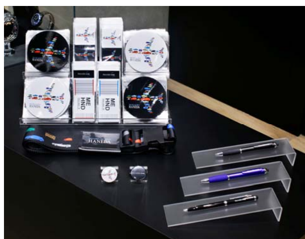
Mercedes me Tokyo HANEDA スーツケースベルト 2,950 円

たくさんのメルセデス・ベンツの車種がデザインされたスーツケースベルト、各種ステッカー、缶バッジなどをラインナップ。デザインが商品を一層魅力的にします。