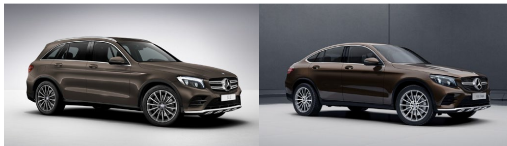
ボディカラー新規設定：796 シトリンブラウン(メタリックペイント)

また、「796 シトリンブラウン」をボディカラーにご選択いただいた場合は、メタリックペイントのオプション価格として、88,000円(税込み)が別途必要となります。