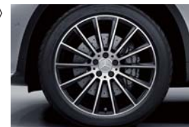
ツインカラー20インチ AMGマルチスポークアルミホイール

●「機能装備」の名称変更について(カタログ 16-21、23、42ページ/Data Information 5、7ページ)