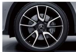
ツインカラー21インチ AMG5ツインスポークアルミホイール