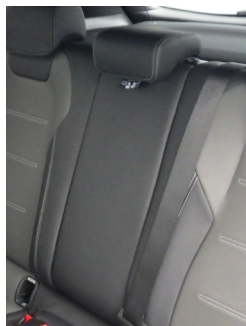
〈廃止〉アームレスト[後席] 〈廃止〉カップホルダー[後席]