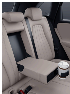
アームレスト[後席] カップホルダー[後席]