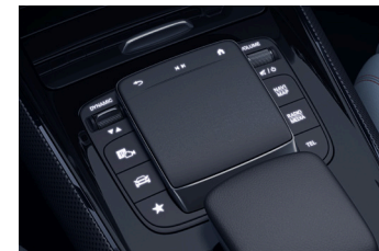
マットブラックパーツ